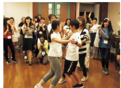
打ち解けた、盛り上がった交流会

さまざまな背景を持つ参加者の考えに触れたことは、このプログラムの大きな魅力です。一人で資料館を訪れたり、書籍で読み取ったりす