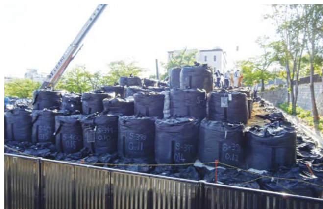
フレコンバッグが集積された仮置き場 (2014年)

放射線に汚染された物質が日常の中に置かれている。福島市では、地震で損壊した建物が修復され、復興イベントが目白押しです。その一方で、市内に住む女性はこう語っています。「原発の過酷な事故とその後の放射能による被災がなきことになれようとしており、(福島