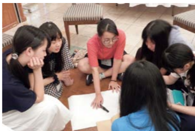
真剣に議論を交わしたワークショップ