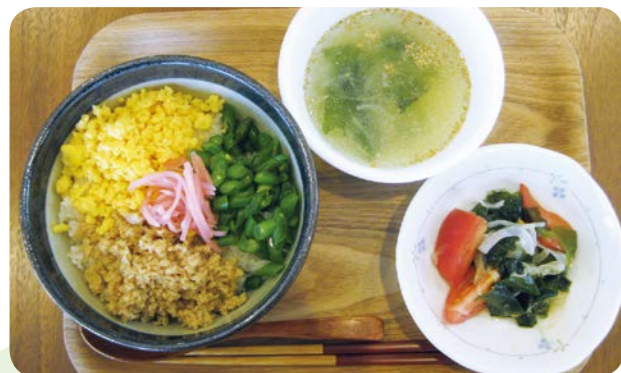
日替わり丼の一例。炒り卵と肉そぼろ、緑の野菜の色鮮やかな「三色丼」。スープとサラダが付いています

長年障がい児支援や療育活動に取り組んできた東京YWCA板橋センターに、この夏、地域の方の遺贈を受けて「つくい館」が完成。次いで9月、館内に「カフェJOY」がオープンしました。ここは、障がいをもつ方たちが働くことを通して持てる力を伸ばし、人と働く喜びを感じられるようにとの願いが込められた場所です。メニューは毎日いろいろな味が楽しめる「日替わり丼」とバザーで親しまれてきた「カレーライス」。地域の人々の温かい集いの場となりそうです。