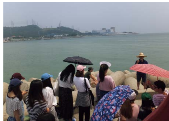
古里原発を臨む海岸で近隣住民のお話を聞いた

日韓ユース・カンファレンスは、日本と韓国の若い世代のリーダーシップ育成と顔の見える交流を通じて、東北アジアで草の根の平和構築を目指すプログラム。1993年に始まり、17回目となる今年は8月1日～4日、韓国・釜山にて、「核のない世界へのエネルギー転換」をテーマに実施した。韓国から20人、日本から14人の参加者は、古里（ゴリ）原子力発電所や新規建設中の新古里5、6号基周辺を訪れて地域住民やNGOメンバーにお話を聞き、また、持続可能な循環型農業を追求する「ミントレ・コミュニティ」では、エネルギーの大量生産・大量消費とは異なる多くの取り組みを見聞した。参加者は自分たちに何ができるかを考え語り合い、最終日には、今後の行動指標としてのアクション・プランを採択した。