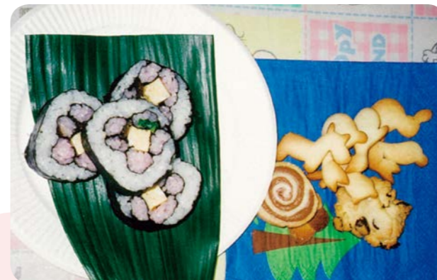
お花模様の切り口に子供たちは喜んだり、驚いたり。今日のおやつは動物型のクッキー。

子育て支援「ほっとスペースなのはな」は、2～3歳の幼児と親を対象に月2回、手作りのおやつをいただきながら、ほっとするひとときを持っています。お月見の団子やクリスマスのカップケーキなど、季節の行事食を大切に取り入れながら、手軽にできるおやつの紹介や、年に数回はお料理会もしています。手作りしたおやつをみんなで楽しくいただくことで、自然に信頼関係が深められるように感じます。毎年夏休みに開く同窓会でも、大きくなった子どもたちとおやつを味わいます。そんなこだわりの活動も20年近くになりました。