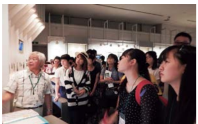
広島平和記念資料館にて

この広島で韓国・朝鮮の人たちもたくさん亡くなっていたという事実を知りませんでした。基本的には、私たちは学校で教えてもらったことを