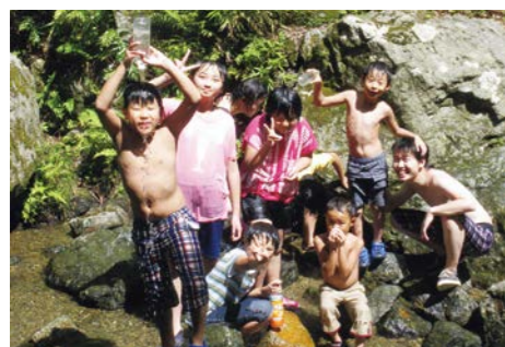
「保養プログラム」で川あそび