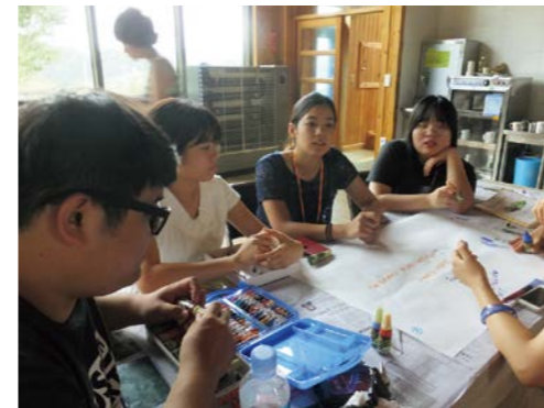
グループディスカッションでは原発問題について語り合った