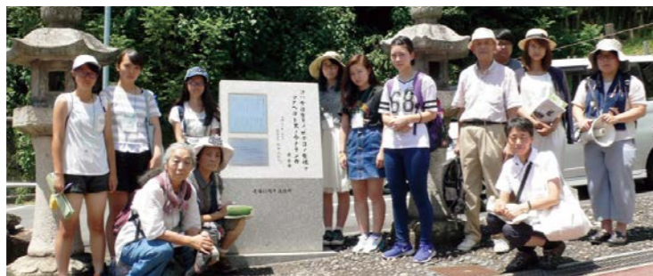
原爆の記憶をたどるフィールドワーク

自分が住む国で、71年前にこれほどの恐ろしい事実があったというのは本当に悲しいことであるし、繰り返してはならないこと。しかし、戦後そう思い続けてきたはずの日本で、5年前原発事故は起きてしまいました。今まであまり原発のことについて理解していなかった私ですが、福島の方のお話を聞いた今では、どうして現在も原発があるのだろうという思いでなりません。私は「忘れること」が一番怖いです。