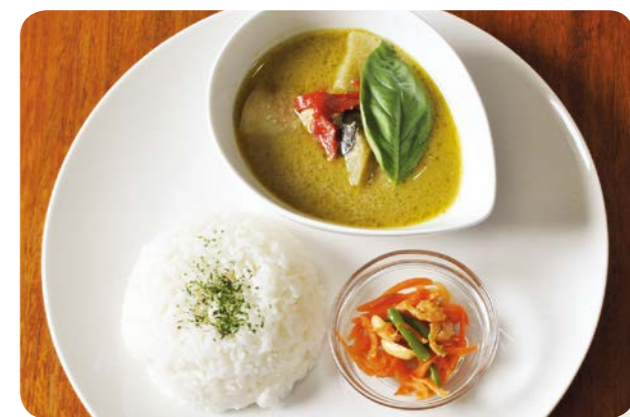
本場タイの食材や香料にこだわっています。周辺のオフィスで働く人たちにも好評です

「Yカフェ パーショ」は、生きづらさ、働きづらさを抱えて家に閉じこもりがちな女性が、安心して集い、働く力をつける場です。会員や職員、ボランティアが彼女たち実習生を見守っています。最初は戸惑う実習生も、接客をするうちに顔見知りが増えて話せるようになり、「自分の居場所」と捉えてくれます。ここでは賄いがなく休憩時間にカフェを利用する実習生もいます。人気は「タイのグリーンカレー」。タイ王宮の料理人に学んだという人から習った本格派。独特の辛さがクセになるそうです。そんな実習生たちも、自信をつけて巣立っていきます。