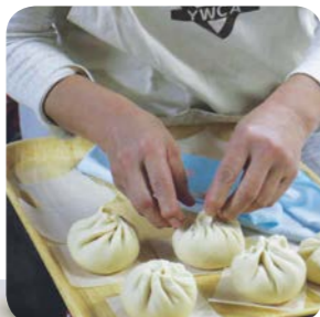
生地が発酵具合、具の混ぜ加減、包み方など、会員たちの口伝承で守られてきたレシピを未来へ伝えられるよう努力しています

30年ほど前、バザーの目玉になるようなメニューを求めていたところ、知人の台湾の方から教えていただいたのが「特製肉まん」でした。たちまちバザーの人気メニューとなり、「肉まんを作るよ」と呼びかけると、みんなが集まってワイワイと作ったものです。最近では会員の高齢化により、肉まん作りが思うようになくなりました。この味が途絶えるかと危ぶまれる一方で、「料理教室を開いて地域のの人に伝えよう」という提案もあり、また新しい物語が生まれそうです。