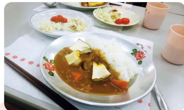
食べやすい甘口カレーに夏野菜をトッピング。近所の精肉店から安価で提供された広島のブランド豚を使用しました

「ロクナナヤーン ワカクサ」は地域の子どもの成長を見守りながら、見えない貧困や孤立状態にある親子を見出し、支援することを目的にこの春スタートしたプロジェクト。子ども食堂の試みとして月に一度「カレーパーティ」を開き、みんなで食卓を囲む楽しさや片付けなどお手伝いを体験してもらっています。一方で、子どもたちへの支援のあり方について専門家に学ぶ講座を設けるなど、ボランティアの養成に努めています。子ども同士で誘い合って、気軽に集える場となれば嬉しいです。