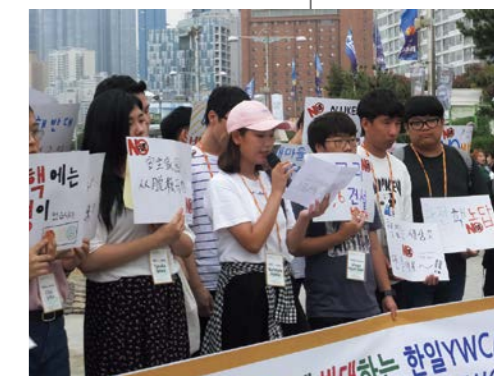
新古里原発5・6号基に反対するアピールを行った

朝の集いで「恨之碑」(※)についてスピーチしました。その中で、沖縄も加害者である事実を受け止め、忘れずにいること、次の世代にも伝えていくことをアピールしました。そして日韓