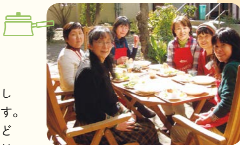
出会いを紡ぐ「ふれあいの居場所食堂 うららかふえ」(京都YWCA)